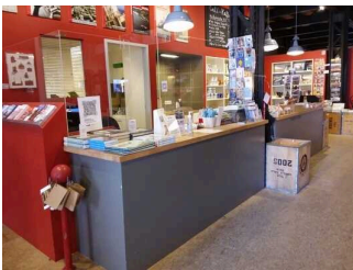
Kasse / Ticketschalter