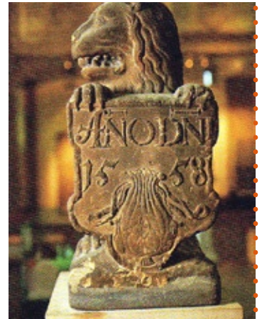
Wappen der Börse (1558)