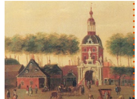
Millerntor (um 1700)